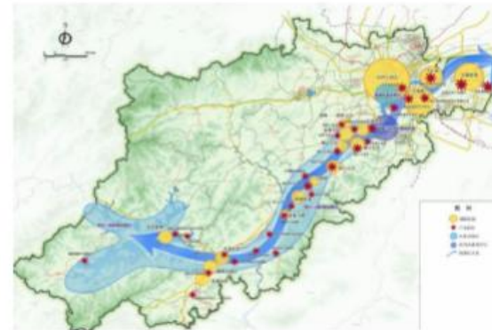
三江两岸城镇空间布局图

“三江两岸”旅游的发展目标：充分发挥旅游休闲业作为“杭州市重要的战略性支柱产业和人民群众更加满意的现代服务业”的带动引领作用，努力将杭州市打造成名副其实的“国际重要的旅游休闲中心”。