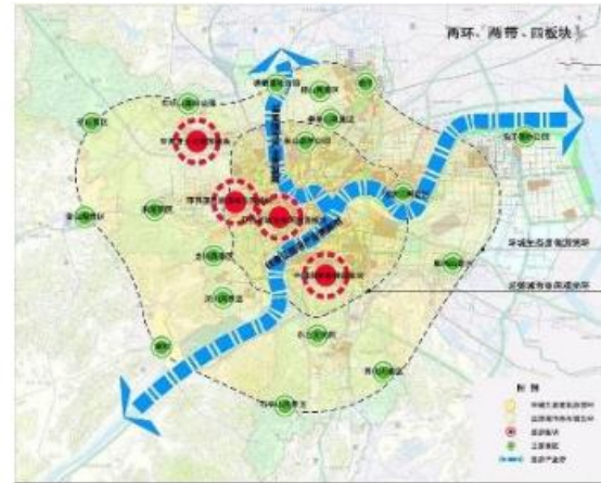
杭州城市旅游总体布局结构

根据三年行动计划以及杭州对旅游休闲产业的长远规划，运河的旅游休闲产业的发展任重道远。如何在运河沿线打造一批富有特色、世界级的旅游产品是本次城市规划考虑的重点。